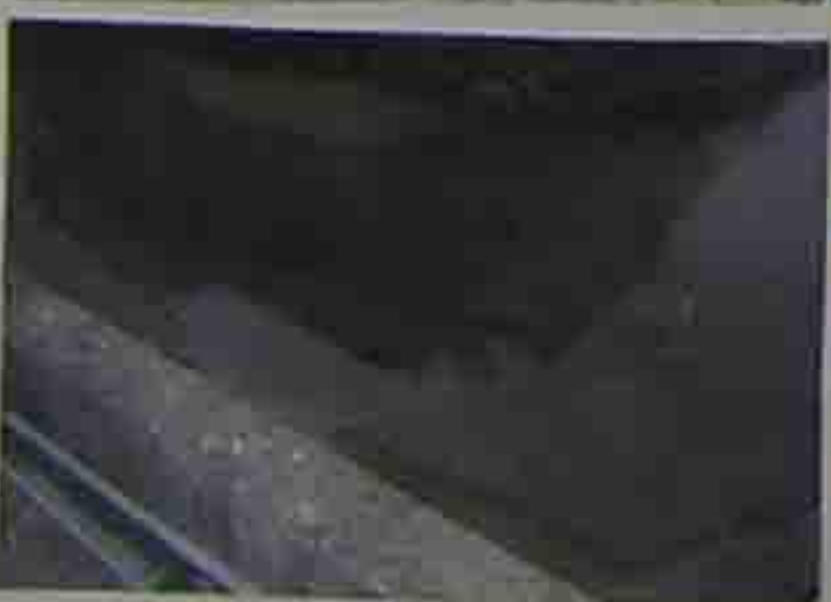
福祉センターの前